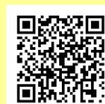
少年相談コーナー

悩みを一人でかかえこまずに、相談してください。保護者や教職員の方からのご相談も受け付けています。